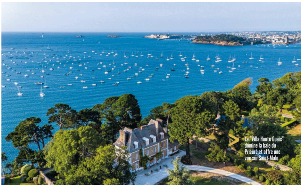
La "Villa Haute Guais" domine la baie du Prieuré et offre une vue sur Saint-Malo.